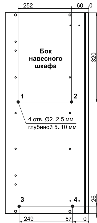
Схема 1. Разметка отверстий