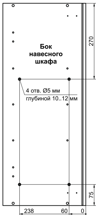
Схема 1. Разметка отверстий